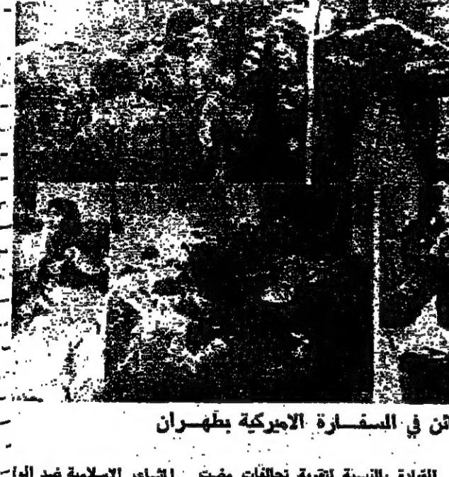
القادة بالنسبة لتقوية تحالفات مفت ورحي ايجاد تحالفات جديدة .

161 - حياء الانسان من ربه . 162 - حياء الانسان من ربه . 163 - حياء الانسان من ربه . 164 - حياء الانسان من ربه . 165 - حياء الانسان من ربه . 166 - حياء الانسان من ربه . 167 - حياء الانسان من ربه . 168 - حياء الانسان من ربه . 169 - حياء الانسان من ربه . 170 - حياء الانسان من ربه .